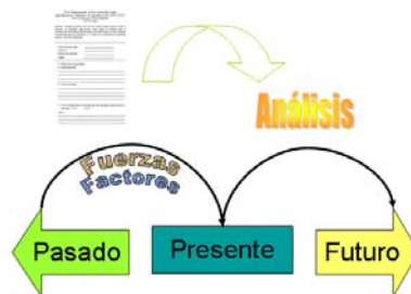
Gráfico No 1: Identificación de fuerzas y factores